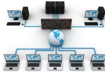
Gambar 3.1 Usulan Infrastruktur Jaringan pada PT XYZ

Contoh: 3. Keterangan Gambar pada BAB III